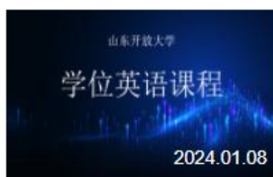
山东开放大学学位英语课程 2861人学习

为进一步提供更有效的学习支持服务，搭建学位英语学习平台，教学团队在国家开放大学学习网开设了“山东开放大学学位英语课程”公开课，并组织团队成员进行了学习资源建设和题库建设，以全面满足师生学习、教学、模拟考试与练习等的教学需求，提升师生参与教学和学习的积极性和便利性。